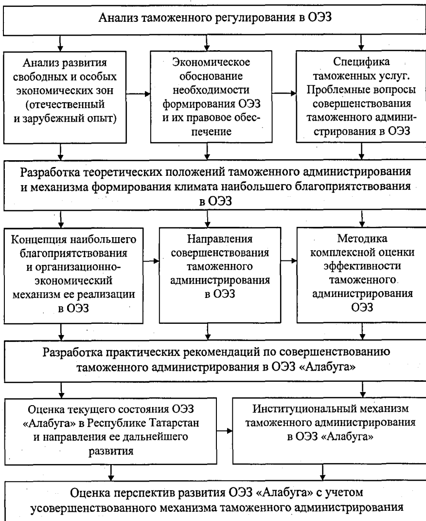
Рис. 1. Блок-схема диссертационного исследования