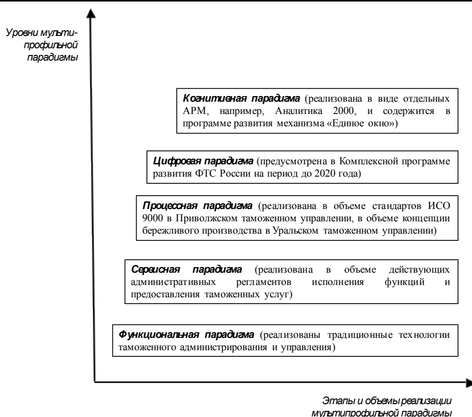
Рисунок 1 - Направления, этапы и объемы реализации мультипрофильной парадигмы развития института таможенного регулирования

Анализ современных подходов к решению проблем, связанных с повышением эффективности управления в условия мультипрофильной эволюции государственных структур, позволяет утверждать, что в стратегической перспективе фундаментальную основу их решения составляет когнитивный (познавательный) подход. В теоретическом плане речь идет, прежде всего, о парадигме формирования знаний для принятия решений и о создании интегративной технологии управления, адаптированной под условия мультипрофильных изменений в объекте управления [Букатова, Макрусев, 1995; Макрусев, 2012; Barlett, Ghoshal, 2001]. Под знанием будем понимать любую структурированную информацию о внешнеэкономической (внешнеторговой) и таможенной деятельности, включая различные модели и закономерности деятельности, а также технологии интеграции знаний.