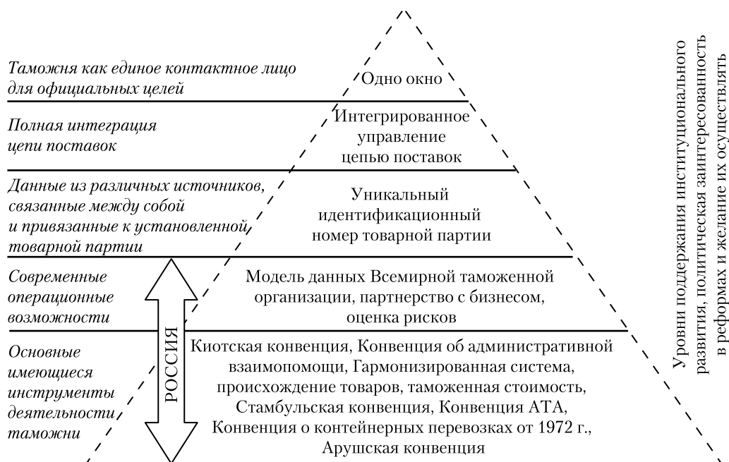
Рис. 1. Концепция развития таможенной системы для решения проблем безопасности и содействия торговле

единого контактного лица в процессе таможенного регулирования и контроля. При реализации такой модели каждой товарной партии присваивается уникальный идентификационный номер, формируемый на основе взаимосвязи данных из различных источников.