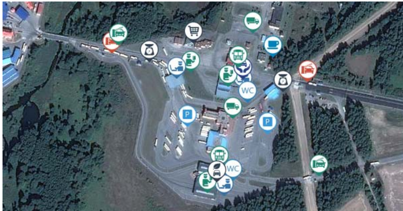
Рис. 2. Инфраструктура пункта пропуска «Берестовица»

По Программе трансграничного сотрудничества Польша–Беларусь–Украина на 2014–2020 гг. осуществляется строительство и реконструкция объектов пограничной инфраструктуры: строительство моста на переходе Бобровники– Берестовица на территории Беларуси (стоимость – около 4,5 млн евро), расширение железнодорожного переезда в Семенувке (стоимость – около 5,6 млн евро) и реконструкция крупнейшего погранперехода Брузги–Кузница (стоимость –3,5 млн евро) 11 , необходимость которой вызвана расширением автодороги А6 Минск–Гродно. Также около перехода строится логистический центр. Финансирование первых двух проектов осуществляется Европейским Союзом.